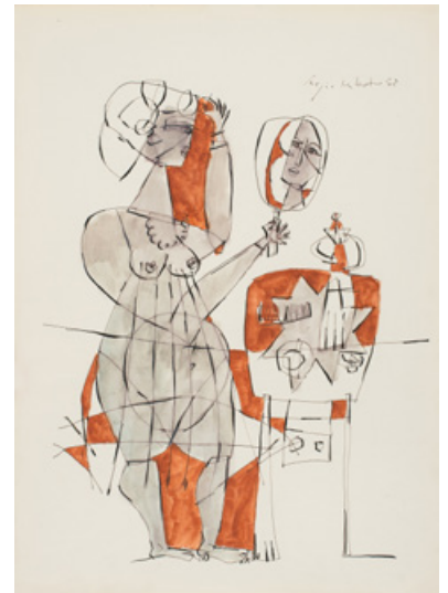
SANS TITRE - 1953 Gouache et encre sur papier - 44 x 31 cm. Galerie Diane de Polignac, Paris