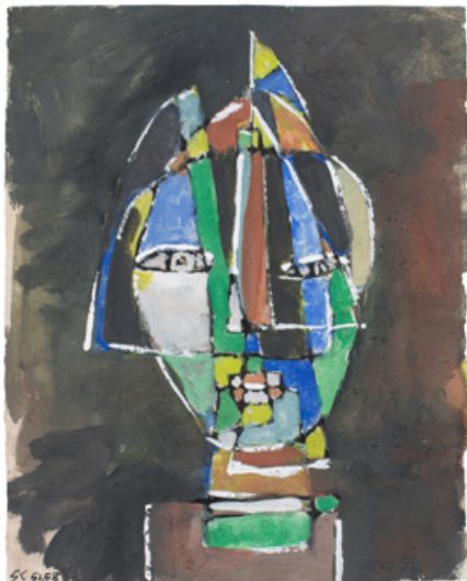
SANS TITRE - 1951 Gouache sur papier 17,5 x 14 cm. Galerie Diane de Polignac, Paris

2 -Jean Bouret « À la découverte de SERGIO de CASTRO », Revue ART , Paris, 16 mars 1951