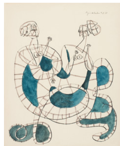
SANS TITRE - 1953 Encre et gouache sur papier - 37 x 30 cm. Galerie Diane de Polignac, Paris