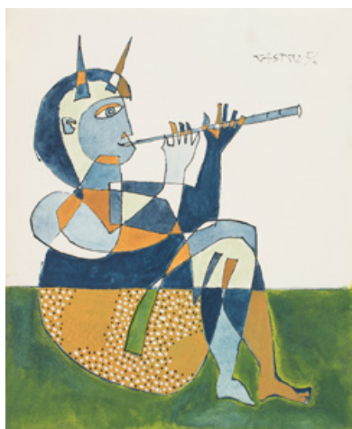
SANS TITRE - 1951 Gouache et encre sur papier - 20,5 x 17 cm. Galerie Diane de Polignac, Paris