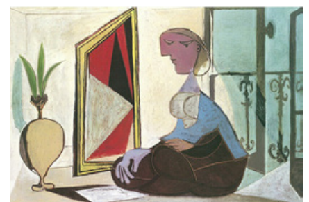
Pablo Picasso - Femme au miroir - 1937 Huile sur toile - 130 x 195 cm. K20 Kunstsammlung, Düsseldorf